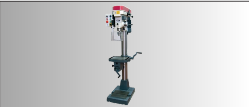
TABLE ROTATIVE ET ÉTAU AVEC RÉGLAGE EN CROIX PANNEAU DE COMMANDE À BASSE TENSION AVEC SÉLECTION DU MODE DE PERÇAGE/TARAUDEGE SYSTÈME DE TARAUDEGE ÉLECTRONIQUE CRÉMAILLÈRE POUR LE DÉPLACEMENT VERTICAL DE LA TABLE DE TRAVAIL TRANSMISSION AVEC SYSTÈME À 3 POULIES MOTEUR A 2 VITESSES TABLE ROTATIVE ET ÉTAU ÉQUIPEMENT DE TARAUDEGE AVEC MICRO MOTEUR A DEUX VITESSES 0,5 KW - 1,0 KW SÉLECTEUR DE SENS DE ROTATION DE LA BROCHE RÂTELIER SUR COLONNE